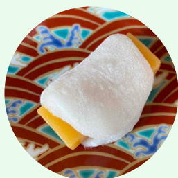
R7夏の宴のお菓子 あんず羊羹の羽二重餅