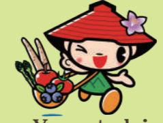
Yamatchi 山形村的形象大使