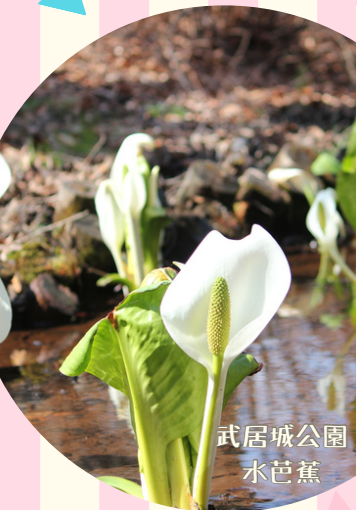
武居城公園 水芭蕉